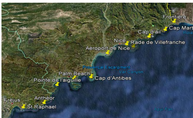
Figure 3 : Découpage par secteur